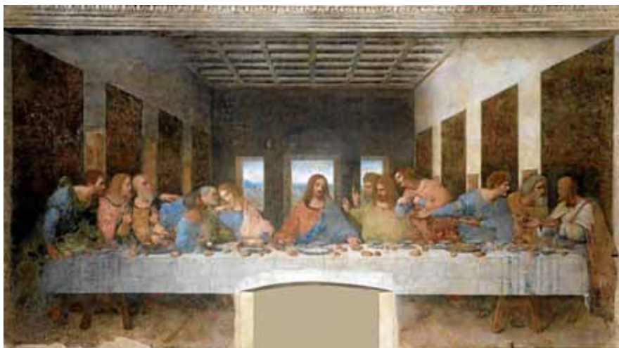
Leonardo da Vinci, Den sidste nadver (1498), Det sixtinske Kapel i Rom

De ældste evangeliske skrifter er jo forfattet af Paulus. I vort nadverritual citeres Paulus for følgende: "at Herren Jesus i den nat, da han blev forrådt, tog et brød, takkede, brød det....". Men igen er det spørgsmålet om hvad man oversætter ordet paradidomi til, som også optræder i denne sammenhæng.