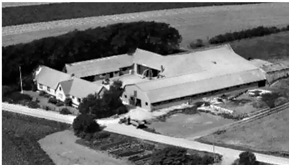
Kanstrupvej 16, 1977